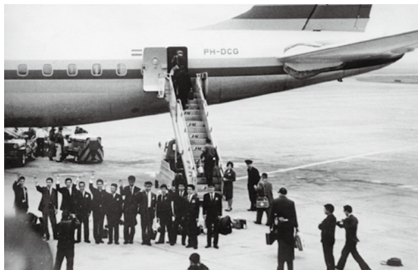
Le premier contingent de volontaires prêts à partir vers leur affectation (1965)

Depuis la première mission envoyée au Laos en 1965, plus de 54.000 volontaires de la JICA ont travaillé de concert avec la population locale de 98 pays et régions. Comme le résume leur mot d'ordre « ensemble avec la population locale », les volontaires de la JICA vivent et travaillent au niveau local, parlant la même langue que la population locale et menant des activités centrées sur la promotion de l'autonomie vers des transformations durables.